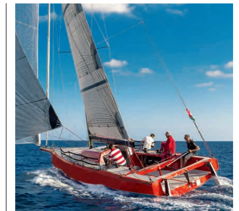
Die ultraleichte Flaar M 37 folgt nur einer Prämisse: maximale Geschwindigkeit S. 118

Horizonte 6 Aktuell 8 Verlagsimpressum 117 Leserbrief 127 Impressum 128 Vorschau 129 Kielwasser 130