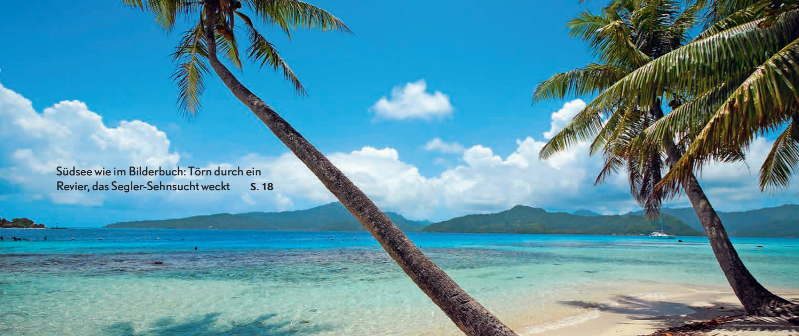
Südsee wie im Bilderbuch: Törn durch ein Revier, das Segler-Sehnsucht weckt S. 18