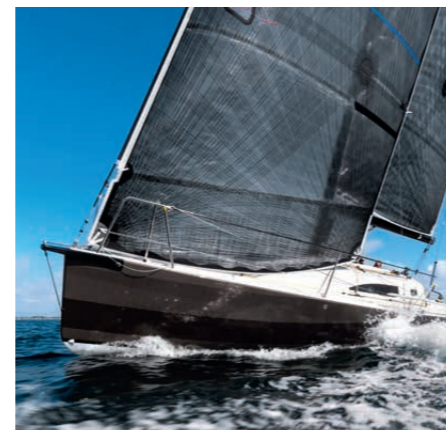
Konsequent sportlich: der klare Charakter der neuen J/99 bestätigt sich im Test S. 76