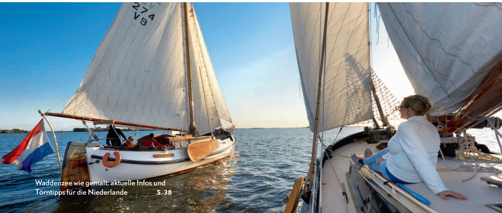
Waddensee wie gemalt: aktuelle Infos und Törntipps für die Niederlande S. 38