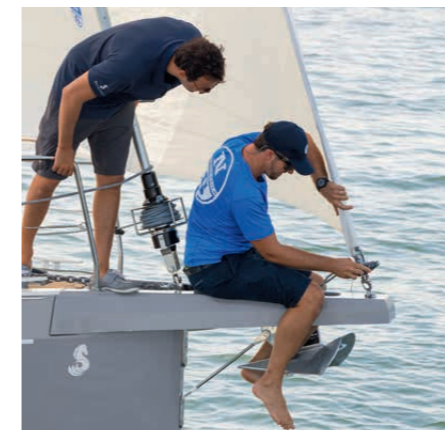
Rollanlagen zicken schon mal. Derartige Macken sind aber leicht zu beheben S. 84