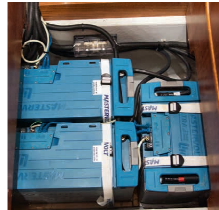
Blei- kontra Lithium-Akkus: Für wen sich der Umstieg lohnt S. 76