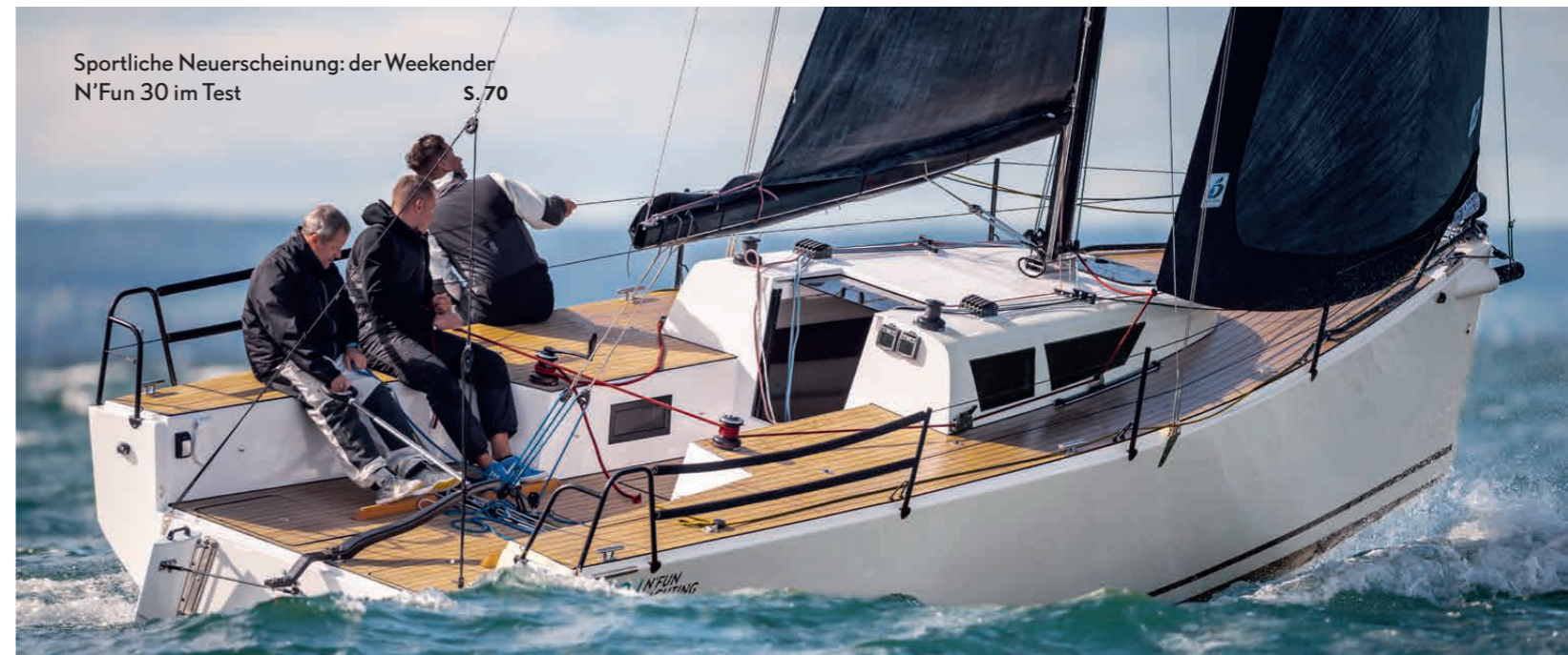
Sportliche Neuerscheinung: der Weekender N'Fun 30 im Test S. 70