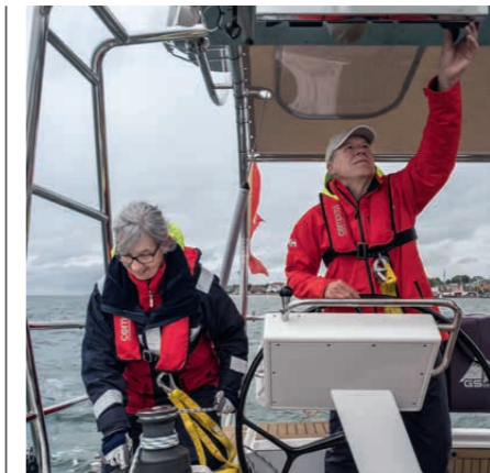
Komfort an Bord: Wie ein Eigner seine Hanse fürs Alter umgerüstet hat S. 102