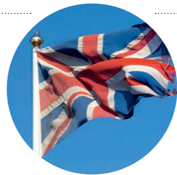
Wo Großbritannien besonders britisch ist: auf Chartershöfen an der Ostküste mit ihrer großen maritimen Historie S. 36