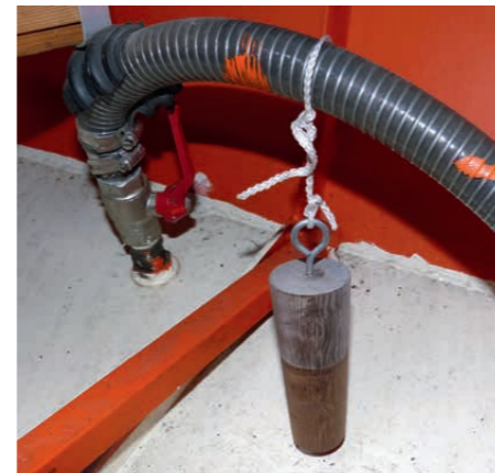
Bei Wassereintritt müssen Crews richtig handeln. Hilfe für die Leckbekämpfung S. 62