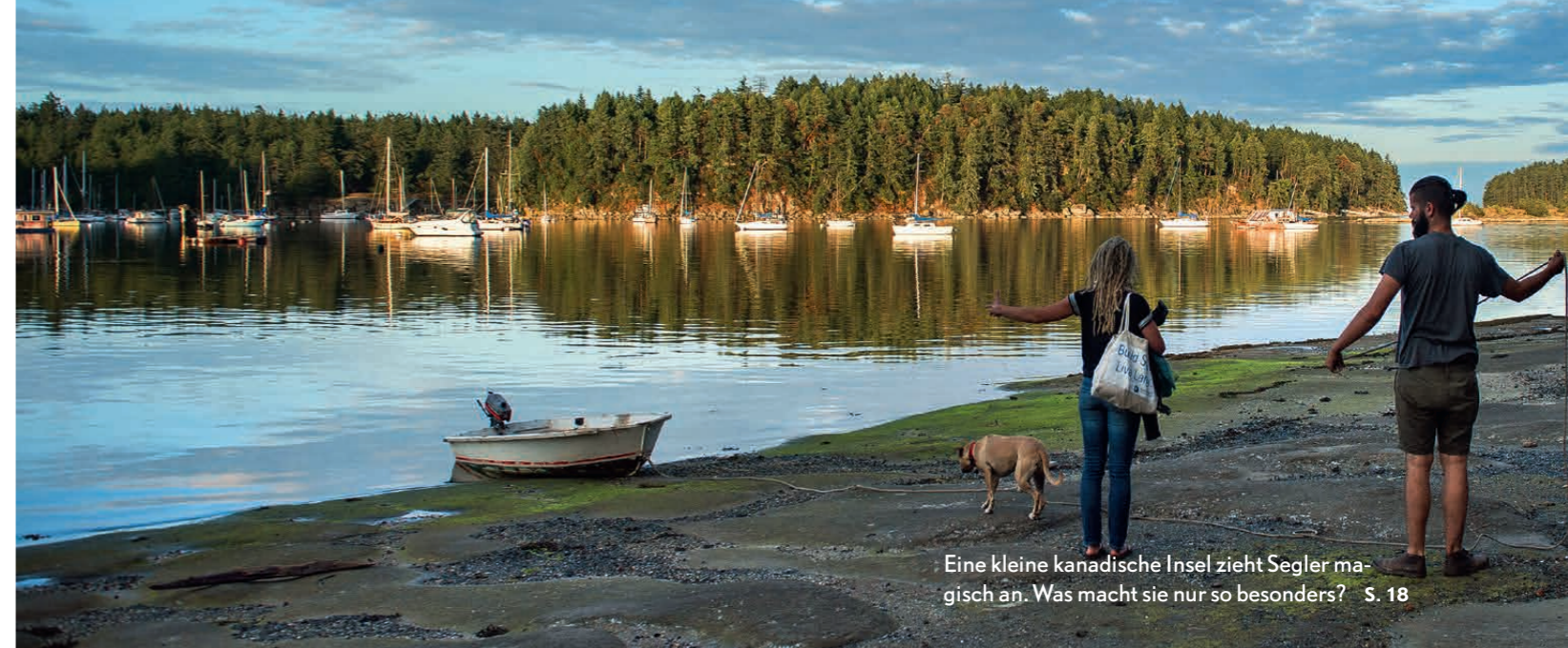
Eine kleine kanadische Insel zieht Segler magisch an. Was macht sie nur so besonders? S. 18