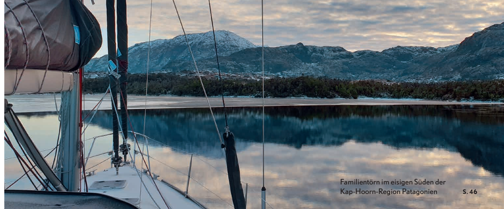
Familiertörn im eisigen Süden der Kap-Hoorn-Region Patagonien S. 46

Die Titelthemen haben eine rote Seitenzahl