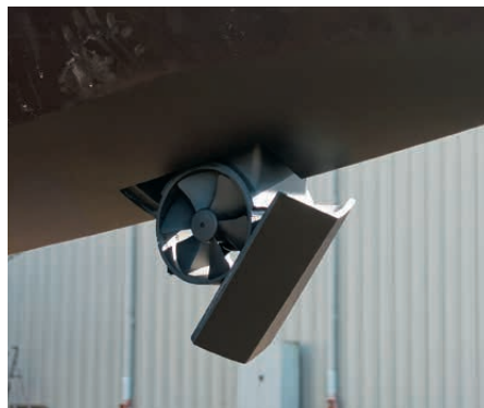
Versteckter Helfer. Wie Bugstrahlruder ein- gebaut und richtig bedient werden S. 76