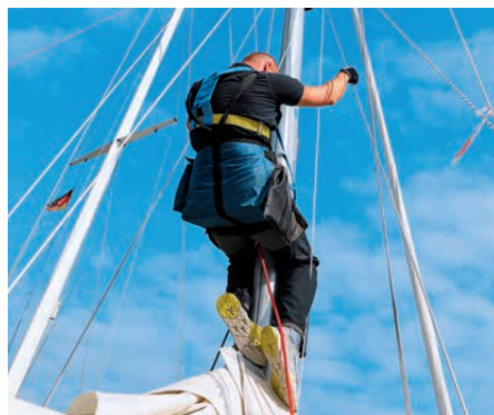
Sicherer Aufstieg: alles über den gefahr- losen Ausflug ins Rigg S. 62