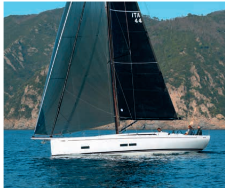
Schnell mit Stil: Test der neuen Grand Soleil 44 aus Italien S. 68

Die Bianca 27 „Holnis“ lichtet YACHT-Fotograf Klaus Andrews ab