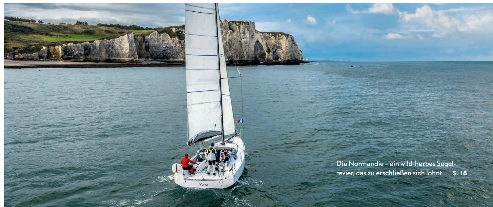
Die Normandie – ein wild-herbes Segel- revier, das zu erschließen sich lohnt S. 18