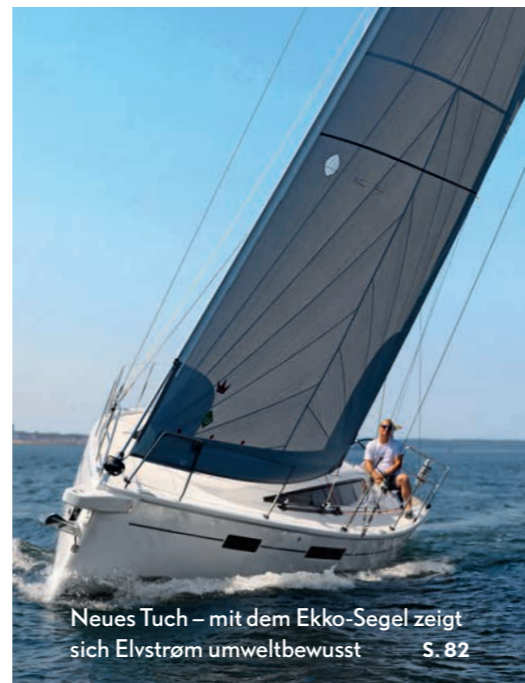
Neues Tuch – mit dem Ekko-Segel zeigt sich Elvstrøm umweltbewusst S. 82