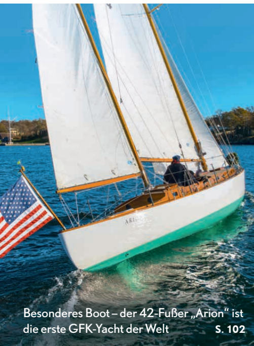
Besonderes Boot – der 42-Fußer „Arion“ ist die erste GFK-Yacht der Welt S. 102