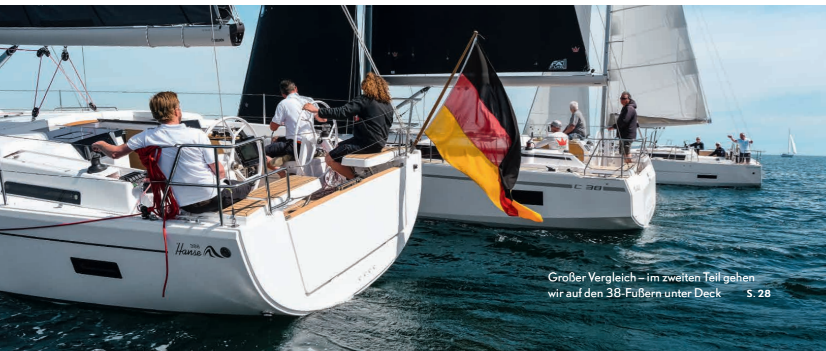
Großer Vergleich – im zweiten Teil gehen wir auf den 38-Fußern unter Deck S. 28