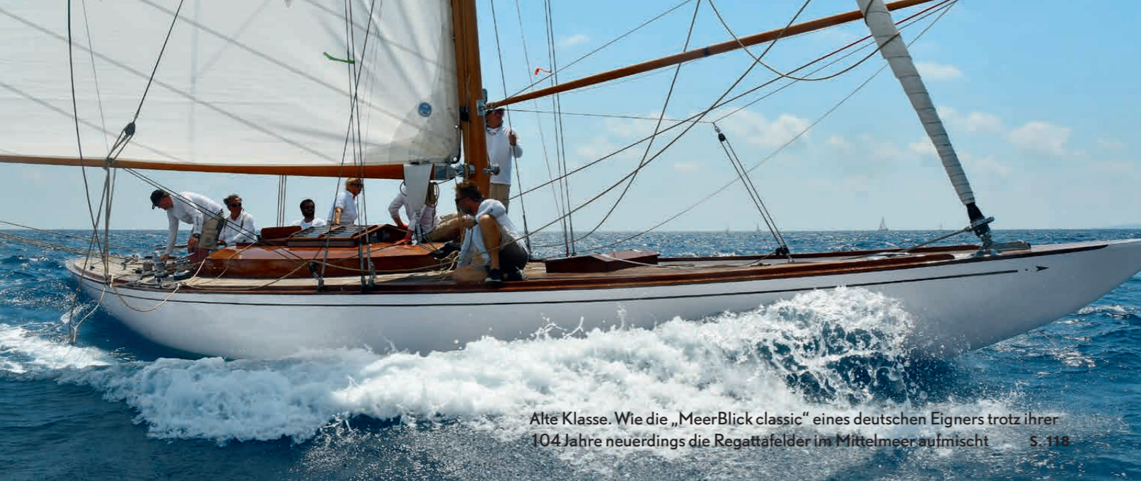
Alte Klasse. Wie die „MeerBlick classic“ eines deutschen Eigners trotz ihrer 104 Jahre neuerdings die Regattafelder im Mittelmeer aufmischt S. 118