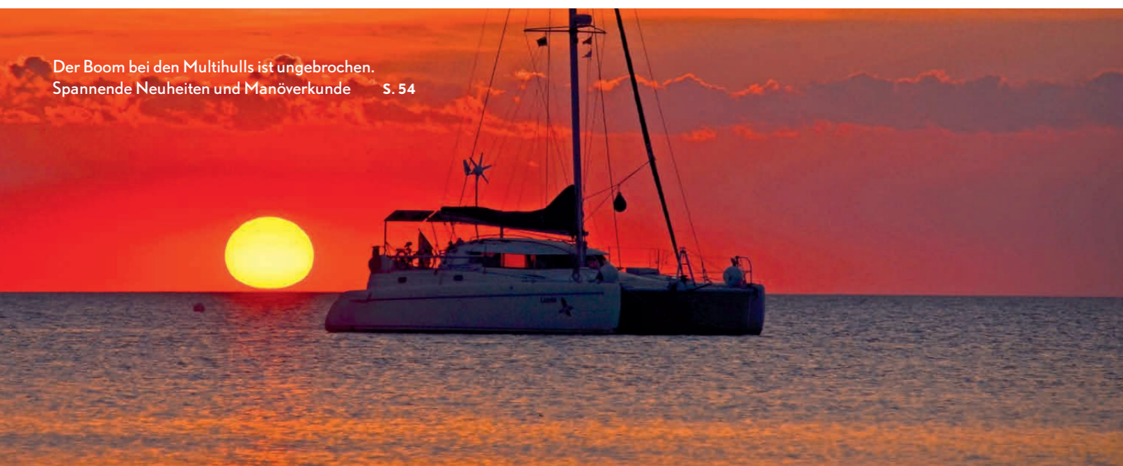
Der Boom bei den Multihulls ist ungebrochen. Spannende Neuheiten und Manöverkunde S. 54