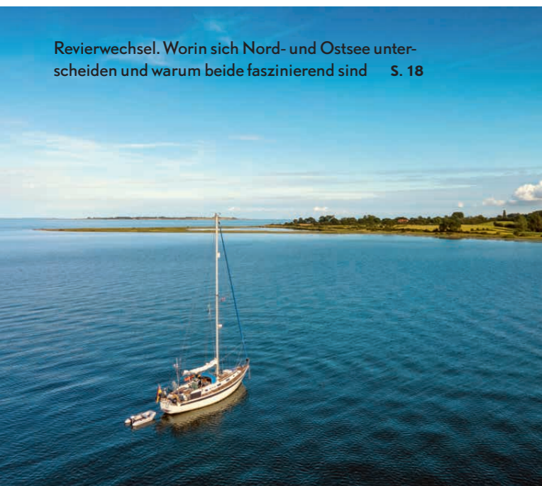
Revierwechsel. Worin sich Nord- und Ostsee unterscheiden und warum beide faszinierend sind S. 18