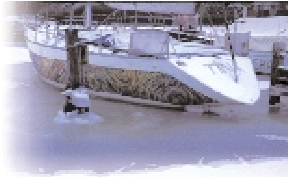
Schiff mit Vergangenheit: Die „Tina“ (Ex-Copper „Tina-i-Punkt“) hat schon elf Überwinterungen in Wasser, Eis und Schnee hinter sich, ohne Schaden zu nehmen.

Lüftung ist gut, Schnee im Schiff aber nicht, spätestens, wenn er schmilzt.